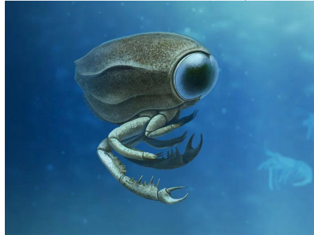
Dollocaris - 165 Ma